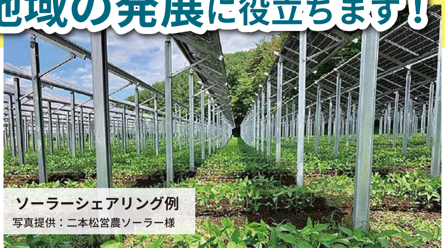
ソーラーシェアリング例