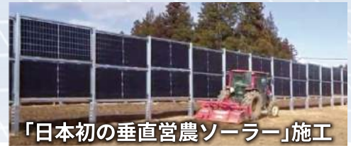
「日本初の垂直営農ソーラー」施工