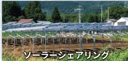
ソーラーシェアリング

太陽光発電と蓄電システムを搭載。売電せず、電力を 可能な限り自家発電で賄う運営を目指します。