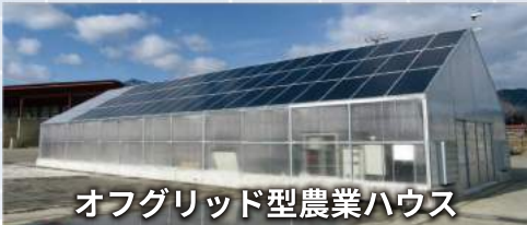
オフグリッド型農業ハウス

太陽光発電と蓄電システムを搭載。売電せず、電力を 可能な限り自家発電で賄う運営を目指します。